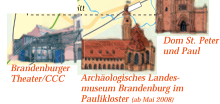
Dom St. Peter und Paul