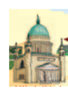
Welterbe der Kulturlandschaft