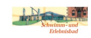
Schwimm- und Erlebnisbad